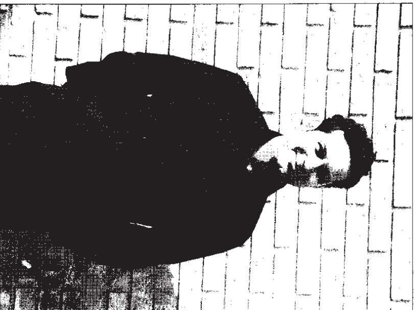
Salvador Claramunt Izquierdo candidat a l'Alcaldia