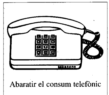
Abaratar el consum telefònic

Això ha provocat que en determinades zones del nostre poble (precisament les més deficitàries en equipaments i infraestructures), molts veïns no hagen tingut ni l'oportunitat d'accedir a esta classe d'energia més barata i neta. Amb la fibra òptica no pot repetir-se el mateix. Ha d'arribar realment a tot el poble, sense excepció.